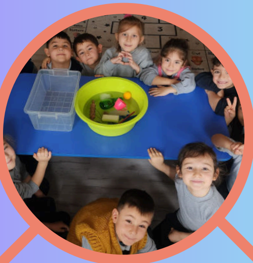
Suyun Kaldırma Kuvveti..